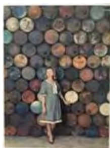
Jeanne-Claude devant Mur d'assemblage présenté à la Galerie J, Paris, juin 1962 Jeanne-Claude in front of Mur d'assemblage [Wall Assembly] shown at Galerie J, Paris, June 1962