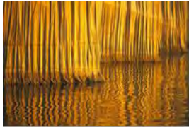
The Pont-Neuf Wrapped, Paris, 1975-1985 [Le Pont-Neuf empaqueté, Paris, 1975-1985] The Pont-Neuf Wrapped, Paris, 1975-1985 © Christo & Jeanne-Claude